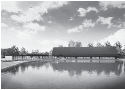
イメージ図 (勾玉池からの外観)

現在、外宮勾玉池のほとりに姿を現しつつある同館は、延べ床面積が約2000㎡、切り妻造りの外観で、その名の通り、神宮式年遷宮の意義を広く伝えることを目的としています。