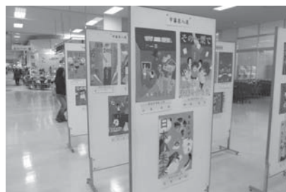
昨年のポスター展の様子

ところ イオンラパーク シヨッピングセンター・1 階インフォメーション付近 内容 市の審査会入賞作品 の展示