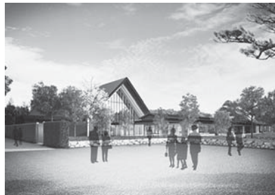
イメージ図 (表参道からの外観)