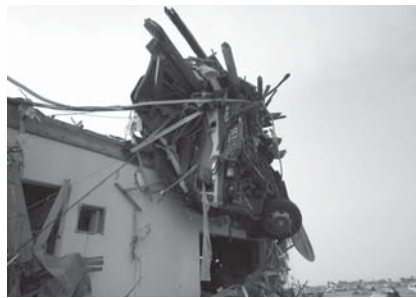
ゆりあげ 名取市閑上地区の被害写真(観光バスが流され、建物に引っ掛かっている状況)