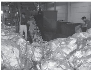
清掃工場に集められたプラスチック製容器包装